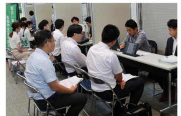
企業ブーストーク