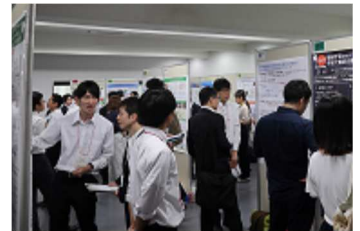
博士人材のポスター発表