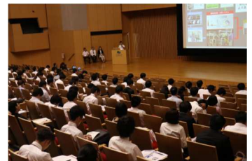
企業2分間プレゼン