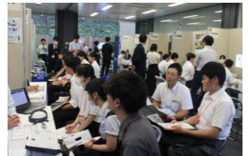
企業ブーストーク