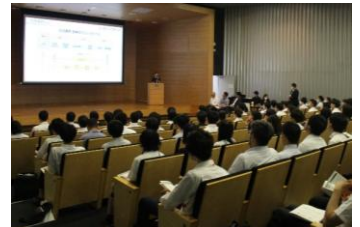
企業2分間プレゼン