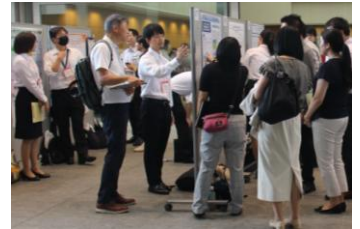
博士人材のポスター発表